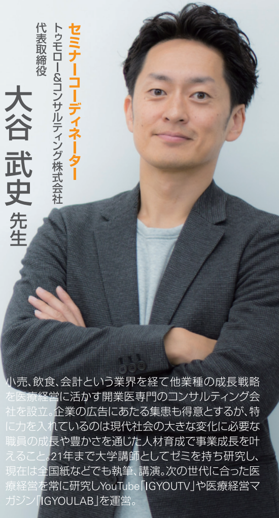
セミナーコーディネーター トウモロコシ&コンサルティング株式会社 代表取締役