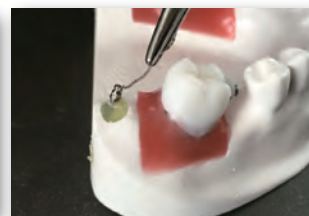
リガチャーワイヤーでフックを作成