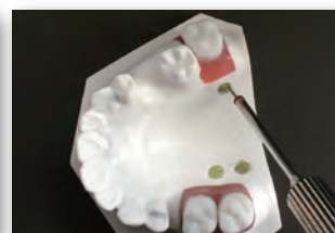
アンカースクリュー埋入実習