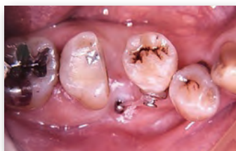
アンカースクリューを使用した下顎小臼歯アップライト症例

動かせる歯牙模型を使用した埋入実習 アンカースクリューを使用し、アップライト・圧下・シザーズバイトの改善等の歯牙移動テクニックを実践します