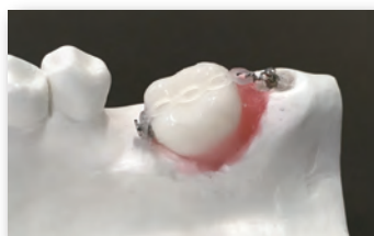
歯牙模型実習：アップライト