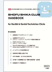
「SHIKA CLUB HANDBOOK」