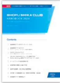
SHIKA CLUB HANDBOOK

次の画面でログインIDとパスワードの入力が必要です。 「SHIKA CLUB HANDBOOK」「Seminarサイトの使い方」をご覧ください。