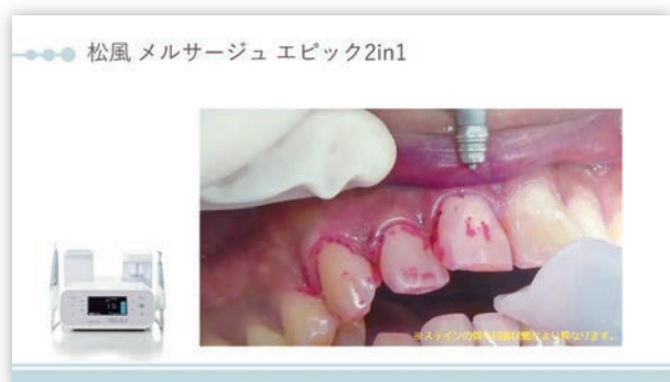
※スライドイメージ