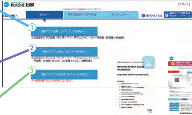
「SHIKA CLUB HANDBOOK」 「Seminarサイトの使い方」