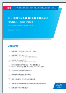
「SHIKA CLUB HANDBOOK」