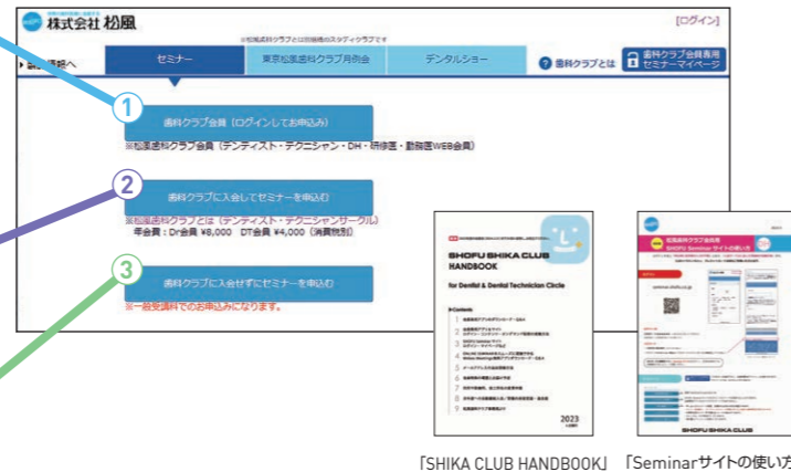
「SHIKA CLUB HANDBOOK」 「Seminarサイトの使い方」