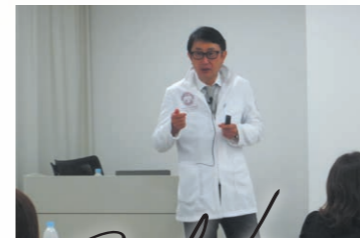
Message from Seminar Lecturer

ホワイトニングは歯科治療における審美治療の入り口としてすでに世間では認知され、やってみたい美容の施術では常に上位に来るほどの市民権を得ています。今回、審美歯科治療としてホワイトニングを院内で定着させる方法を皆様に提案させていただきたいと思っております。