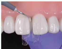
フロアブルレジンを充填