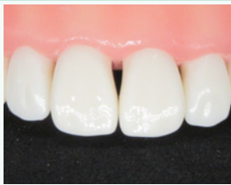
ブラケットライアングル 模型歯