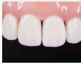
コンポジットレジン修復後