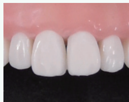
コンポジットレジン修復後