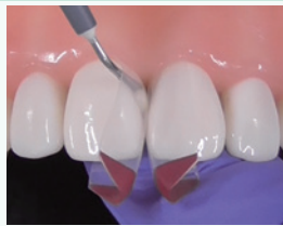
フロアブルレジンを充填