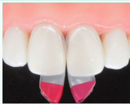
バイオクリアー ブラック トライアングルマトリッ スを装着