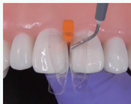
ダイヤモンドウェッジを装 着し、反対側にフロアブル レジンを充填