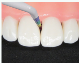
バイオクリアー ブラック トライアングルゲージを挿 入